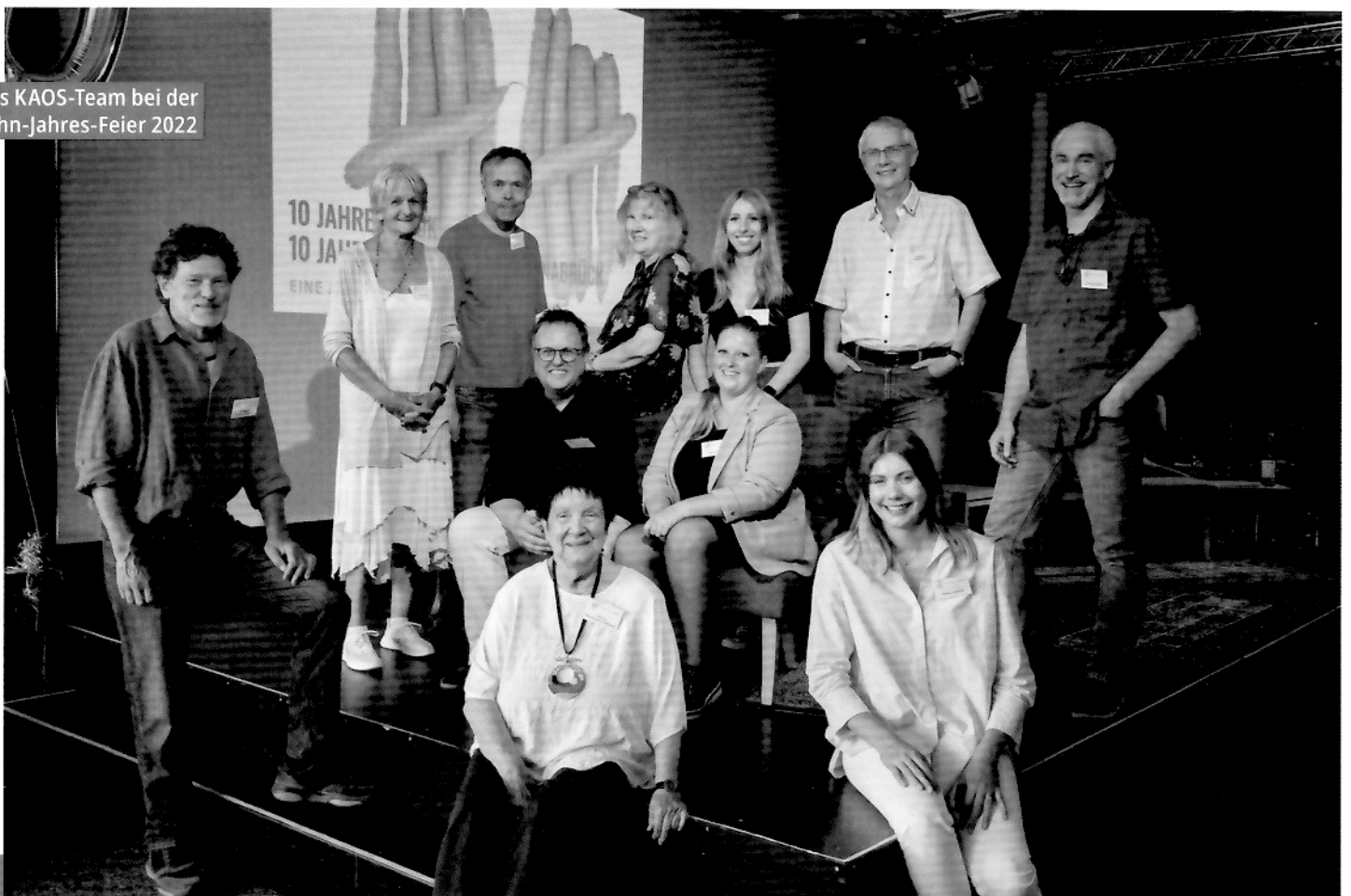
Das KAOS-Team bei der Zehn-Jahres-Feier 2022

Ciolek ist klassisch ausgebildeter Sänger und hat ein Büro für Grafikdesign. Die Vereinsarbeit macht er größtenteils